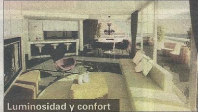
Luminosidad y confort