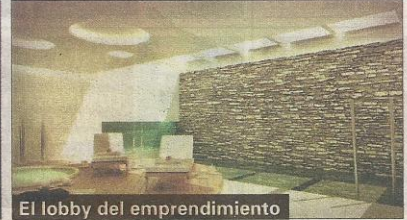
El lobby del emprendimiento