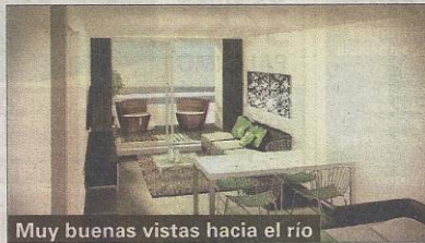
Muy buenas vistas hacia el río