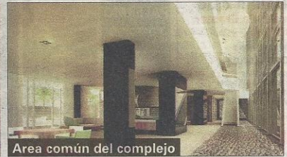
Area común del complejo